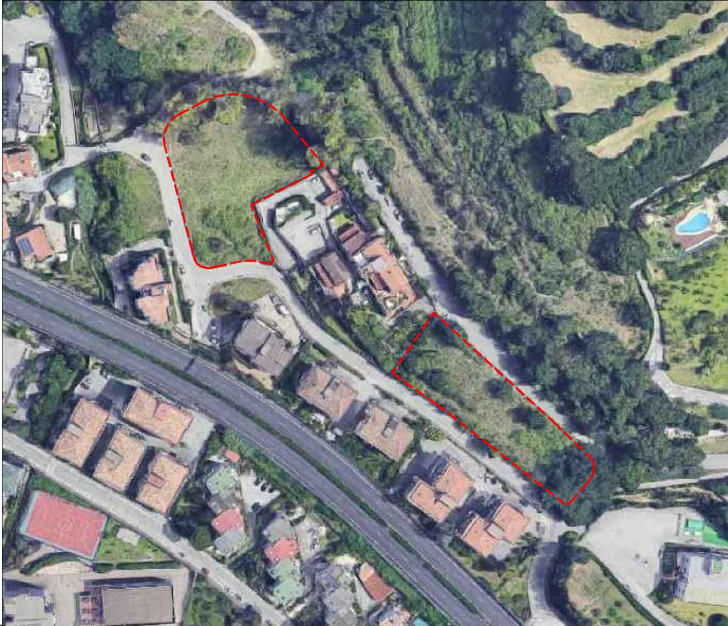
CR_17-18 - PROGETTO

P.U.A. COMPARTO EDIFICATORIO CR_17-18 AVENTE VALORE DI PIANO DI LOTTIZZAZIONE (PDL) DI CUI ALLA LEGGE 17/08/1942 N. 1150 ART.LI 13 E 28 VIA MOSCANI - SALERNO